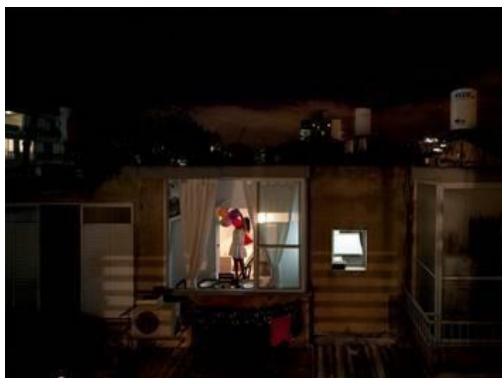
מתוך סדרת 'בין השמשות'

Award of Achievement in Photography – City College of San Francisco