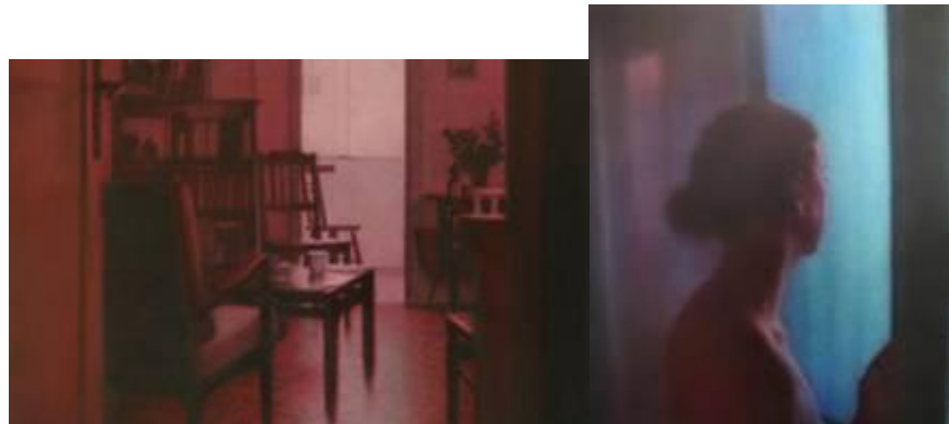
איורים עוזי קצב